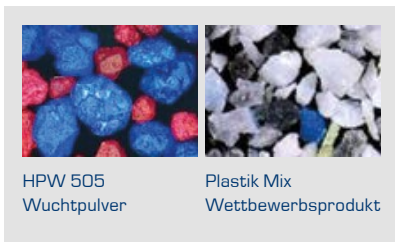
HPW 505 Wuchtpulver

Wir sind der einzige Hersteller in Europa der die volle Bandbreite im Nutzfahrzeugbereich bietet, mit Schlag- und Klebegewichten sowie einer Linie von vibrationsdämpfenden Produkten für die reifeninterne Anwendung.