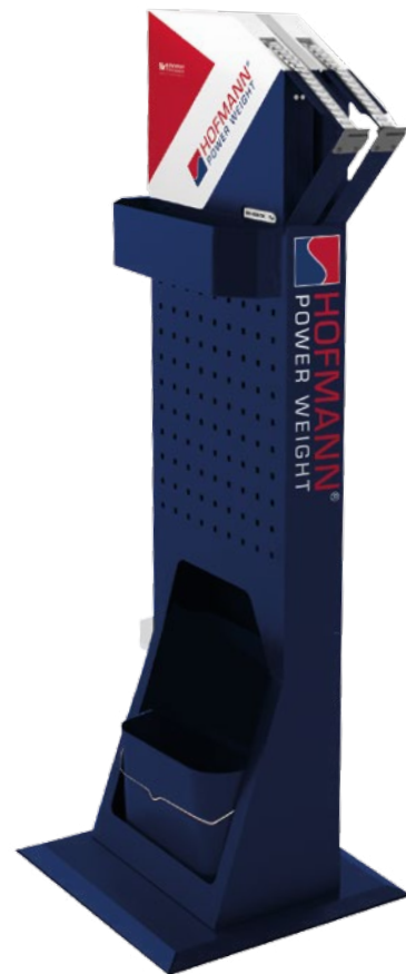
SPEEDCUT® MIT BODENSTÄNDER INKLUSIVE ZUBEHÖR